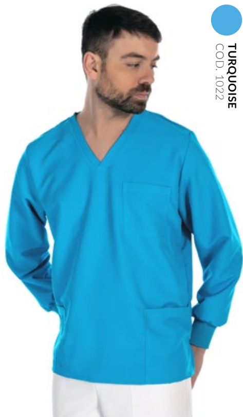
TURQUOISE COD. 1022