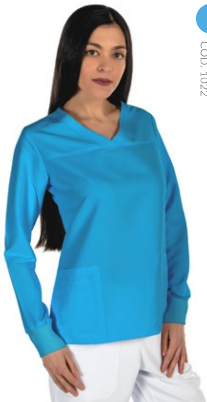
TURQUOISE COD. 1022