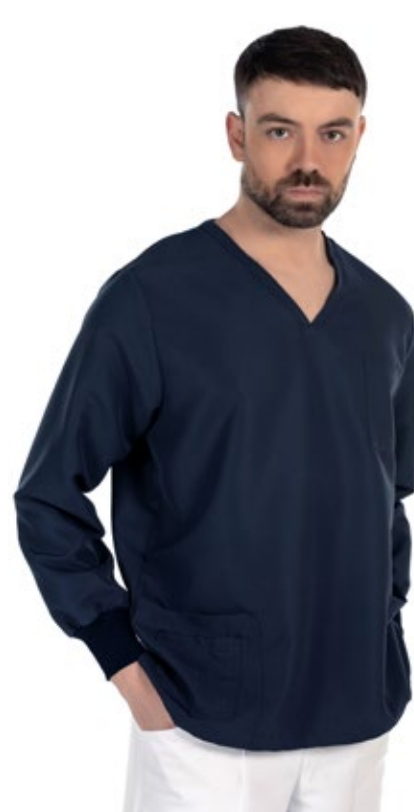
DARK BLUE COD. 1019