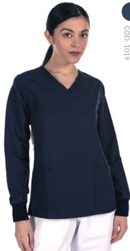
DARK BLUE COD. 1019