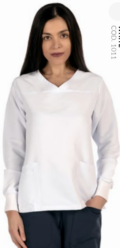
WHITE COD. 1011