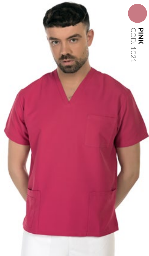
PINK COD. 1021