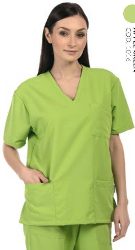
APPLE GREEN COD. 1016