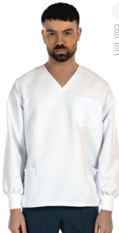
WHITE COD. 1011