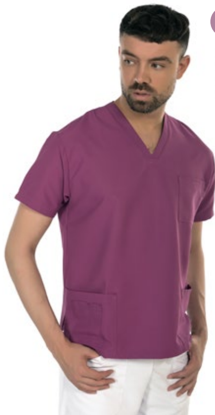
VIOLET COD. 1015